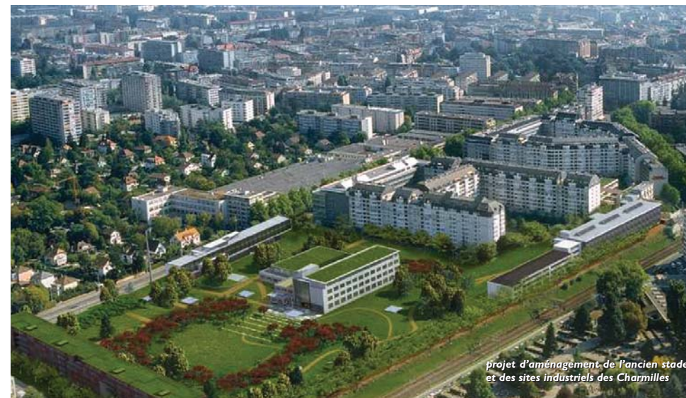
projet d'aménagement de l'ancien stade et des sites industriels des Charmilles

C'est sans doute la plus belle reconversion que l'on pouvait imaginer pour cette portion de la Ville. D'ici 2008, en lieu et place du stade des Charmilles et de la friche industrielle laissée par Tavano suite à sa faillite en 1995, un grand parc aura vu le jour. Situé dans le rectangle formé par la rue de Lyon, le chemin des Sports,