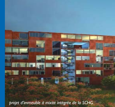
projet d'immeuble à mixité intégrée de la SCHG

Téléphone du CPM: 022 329 67 22 de 10h30 à 12h30 et de 15h30 à 17h sauf mercredi après-midi