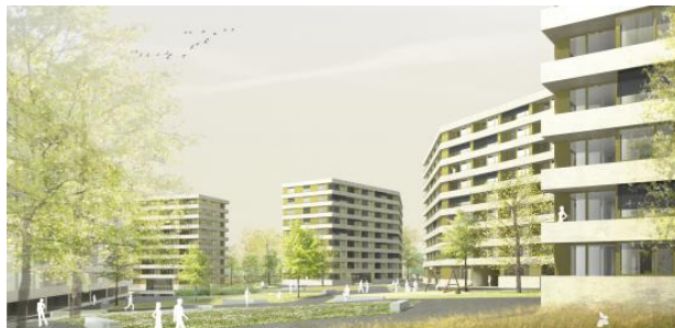
Visualisation 3D du projet lauréat de Timothée Giorgis Architectes (Image: Timothée Giorgis Architectes)