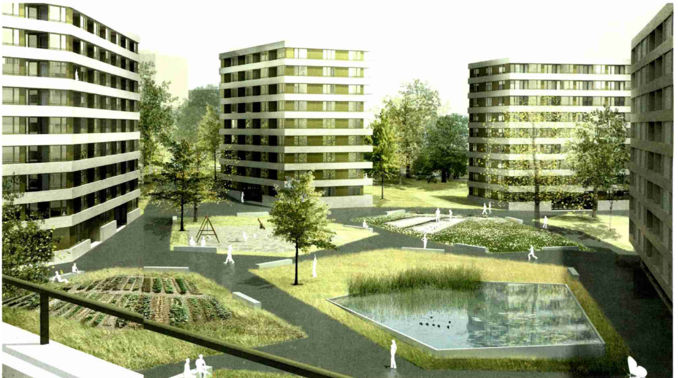
Verdichtete Gartenstadt: das Siegerprojekt von Timothée Giorgis.