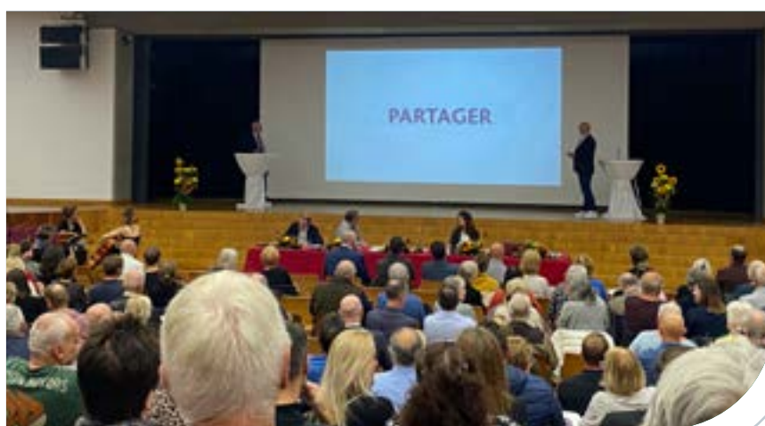
350 PERSONNES ONT ASSISTÉ À L'AGO ET VISIONNÉ UN FILM CONSTRUIT AUTOUR DES VALEURS DE LA COOPÉRATIVE.

L'Assemblée générale 2023 a été une soirée mémorable, marquée par des décisions stratégiques importantes, une nouvelle orientation, et une célébration du dynamisme coopératif. Nous sommes impatients de continuer à œuvrer ensemble pour un avenir prometteur pour la Coopérative et pour la communauté genevoise. Rendez-vous l'année prochaine !