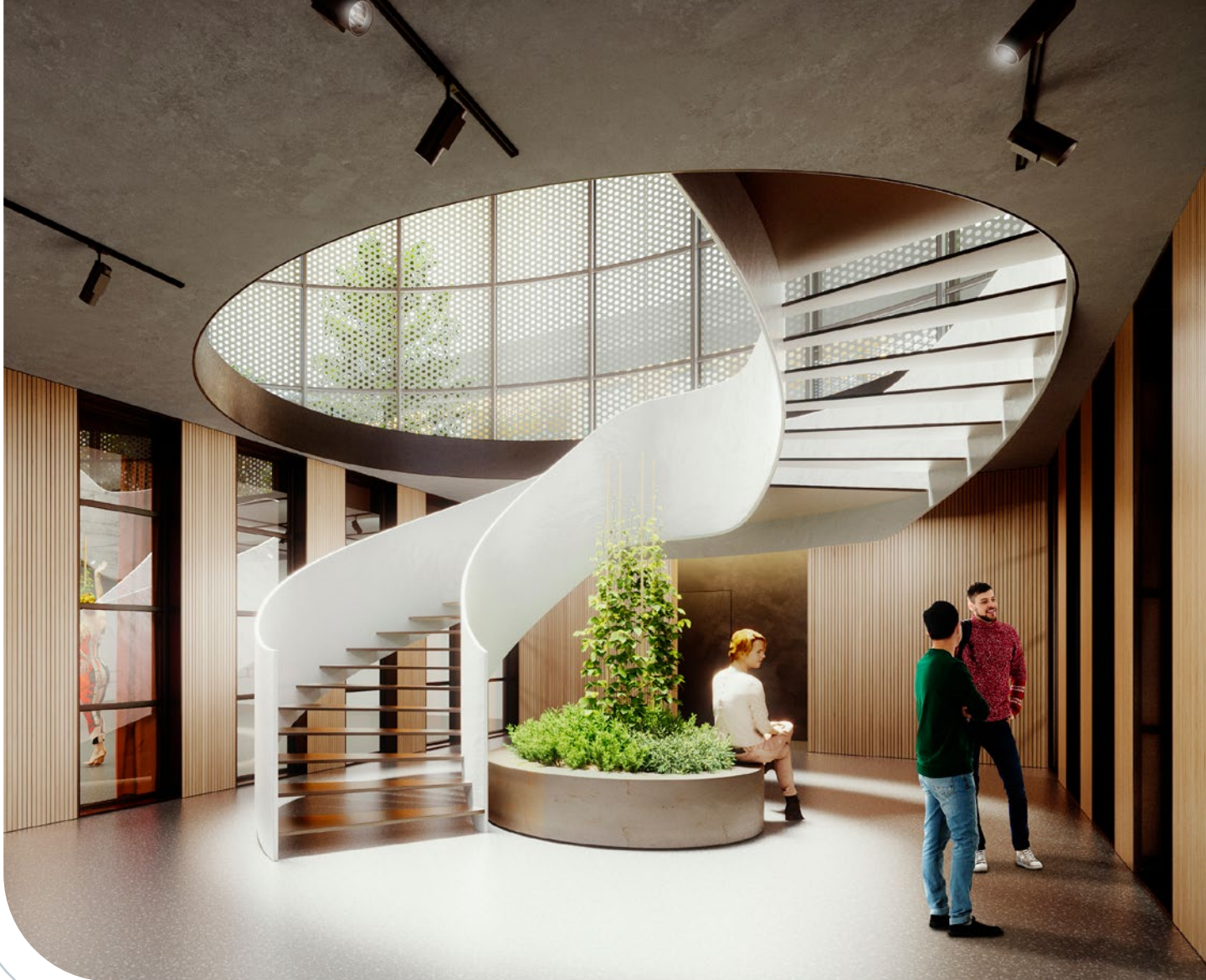
PROJET LES CITERNES - ILLUSTRATION D'AMBIANCE