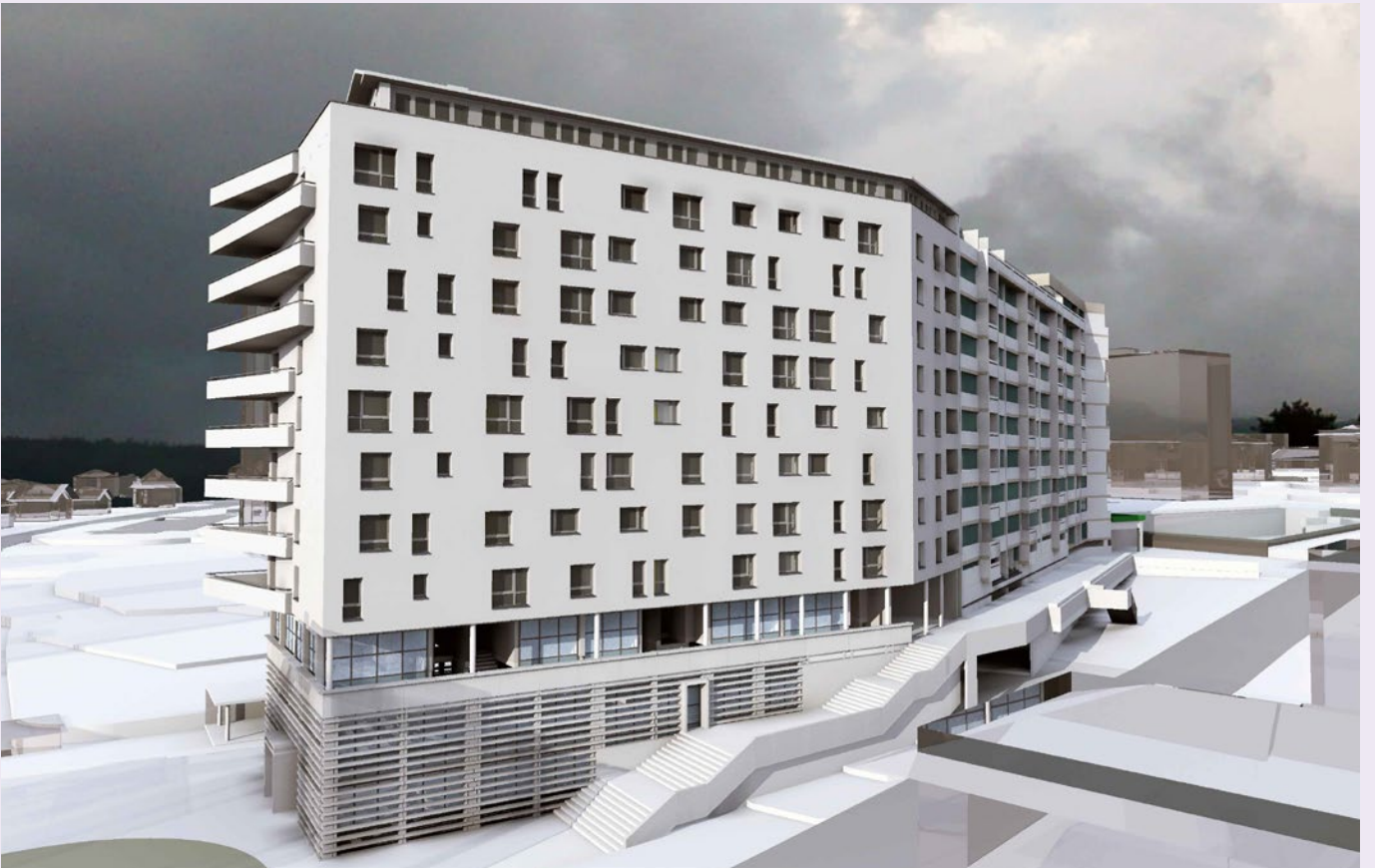
...À UN NOUVEAU QUARTIER.