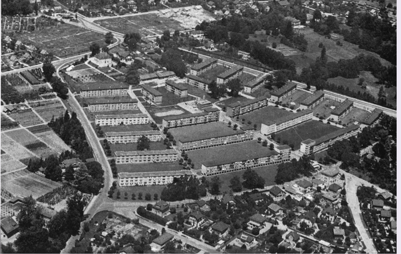
D'UN ANCIEN QUARTIER...