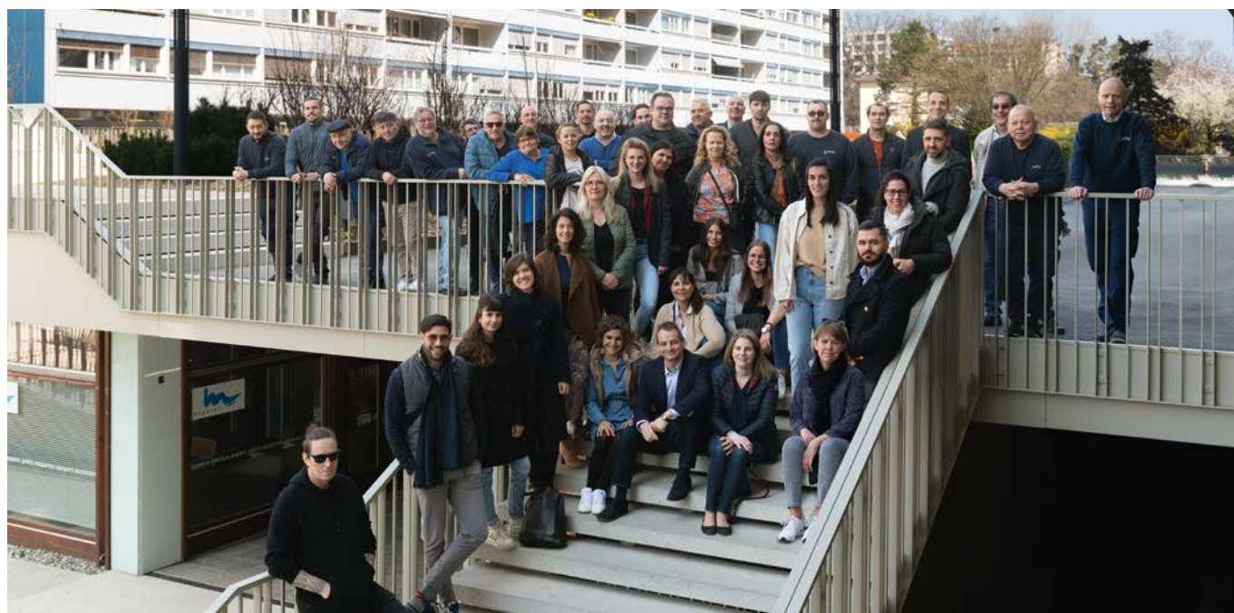
ÉQUIPE SCHG AU COMPLET !

Pour en savoir plus, rendez-vous le 20 octobre prochain à l'Assemblée Générale. Rejoignez-nous et faites entendre votre voix.